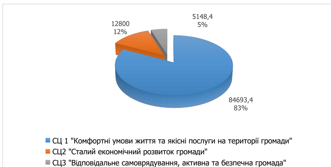
Рисунок 3.1 Розподіл фінансового ресурсу на впровадження Плану заходів з реалізації Стратегії розвитку Кобеляцької ТГ на період до 2027 року у розрізі стратегічних цілей

Фінансову основу плану заходів з реалізації Стратегії розвитку Кобеляцької територіальної громади формує цілий комплекс джерел, які включають як кошти бюджетів різного рівня, так і ресурси програм міжнародної технічної допомоги, національних фондів підтримки місцевого самоврядування тощо. План побудований з урахуванням реалістичності забезпечення прогнозованих обсягів фінансування проєктів місцевого розвитку за усіма визначеними як пріоритетні напрямками (рис. 3.1, рис. 3.2).