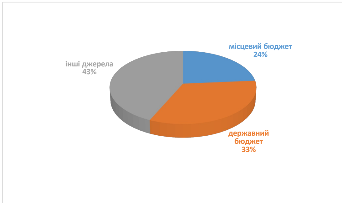
Рисунок 3.3 Розподіл фінансового ресурсу на впровадження Плану заходів з реалізації Стратегії розвитку Кобеляцької ТГ у розрізі джерел надходження

Розподіл фінансових ресурсів протягом усього періоду реалізації Плану заходів свідчить про поступове зростання ролі зовнішніх джерел фінансування, зокрема коштів міжнародних партнерів, грантових програм та інших позабюджетних ресурсів, частка яких становить 43%. Такий підхід обумовлений необхідністю залучення додаткових ресурсів для реалізації інфраструктурних, соціальних та енергоефективних проєктів в умовах обмежених можливостей місцевого бюджету та високої конкуренції за державне фінансування.