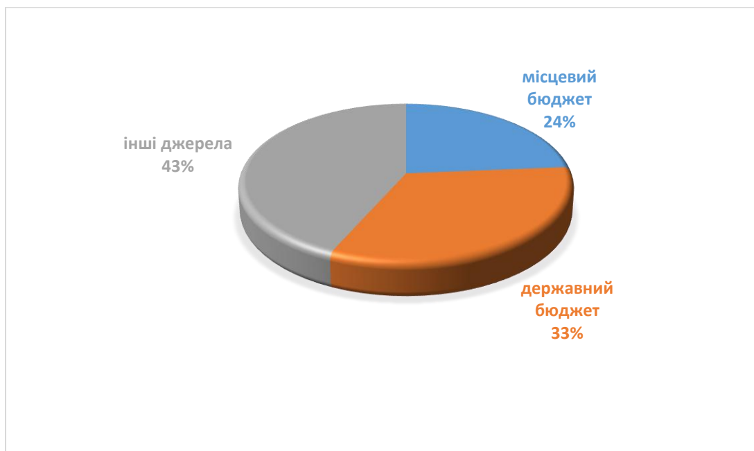
Рисунок 3.3 Розподіл фінансового ресурсу на впровадження Плану заходів з реалізації Стратегії розвитку Кобеляцької ТГ у розрізі джерел надходження

Розподіл фінансових ресурсів протягом усього періоду реалізації Плану заходів свідчить про поступове зростання ролі зовнішніх джерел фінансування, зокрема коштів міжнародних партнерів, грантових програм та інших позабюджетних ресурсів, частка яких становить 43%. Такий підхід обумовлений необхідністю залучення додаткових ресурсів для реалізації інфраструктурних, соціальних та енергоефективних проєктів в умовах обмежених можливостей місцевого бюджету та високої конкуренції за державне фінансування.