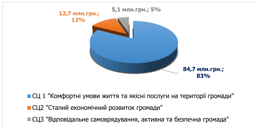
Рисунок 3.1 Розподіл фінансового ресурсу на впровадження Плану заходів з реалізації Стратегії розвитку Кобеляцької ТГ на період до 2027 року у розрізі стратегічних цілей

Фінансову основу плану заходів з реалізації Стратегії розвитку Кобеляцької територіальної громади формує цілий комплекс джерел, які включають як кошти бюджетів різного рівня, так і ресурси програм міжнародної технічної допомоги, національних фондів підтримки місцевого самоврядування тощо. План побудований з урахуванням реалістичності забезпечення прогнозованих обсягів фінансування проєктів місцевого розвитку за усіма визначеними як пріоритетні напрямками (рис. 3.1, рис. 3.2).