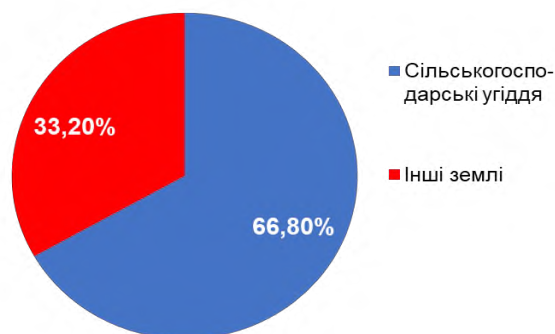
Рис. 1. Загальна структура земель Кобеляцької ТГ, станом на 01.01.2023р.