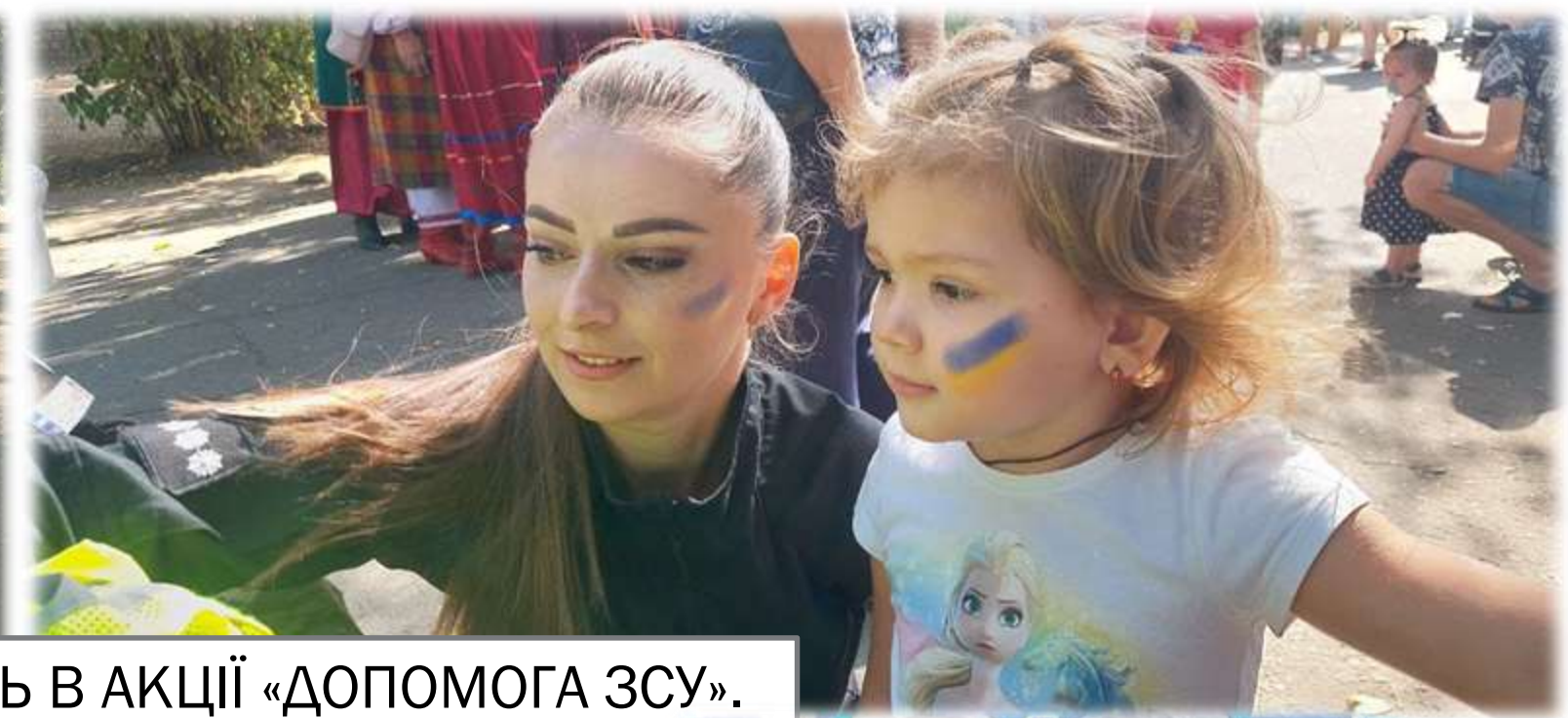
УЧАСТЬ В АКЦІЇ «ДОПОМОГА ЗСУ».