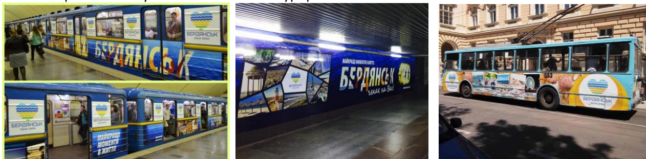
Рис. 3: Реклама м. Бердянськ у містах Київ, Харків, Львів

- розповсюдження у вагонах поїзда «Інтерсіті+» міжнародного сполучення за маршрутом «Київ – Львів – Перемишль» буклетів «Улюблений курорт».