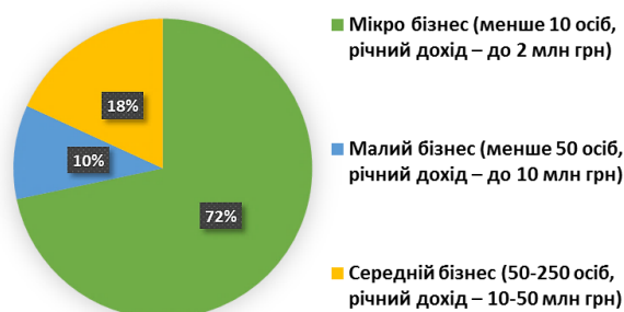
Рис. 2: Розподіл компаній м. Бердянськ за розмірами