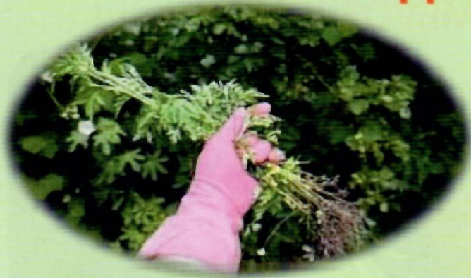
Вирування з корінням до цвітіння