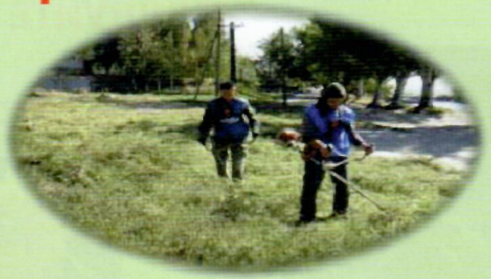
Скошування: липень-серпень, повторне через 3 тижні