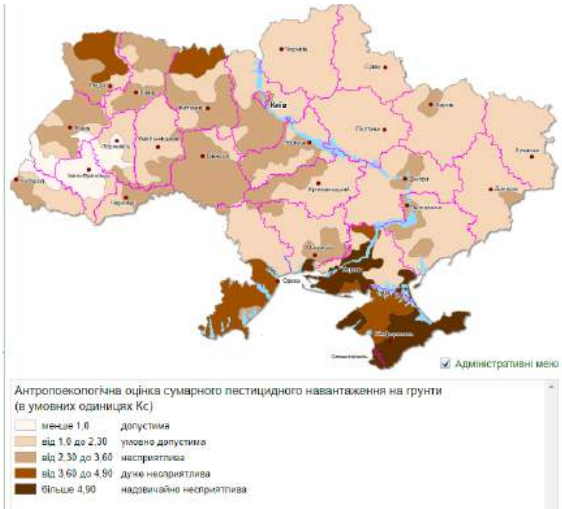
Рис. 3. Пестицидна навантаженість ґрунтів України

Дослідження дають змогу стверджувати, що у межах Волинської області зосереджено незначний вміст радіоактивних елементів. Результати комплексного радіологічного моніторингу за період 2012–2018 рр. свідчать про зниження вмісту радіоактивних елементів у ґрунтах. Вміст Cs^{137} та Sr^{90} у рослинній продукції не перевищує гранично допустимих концентрацій.