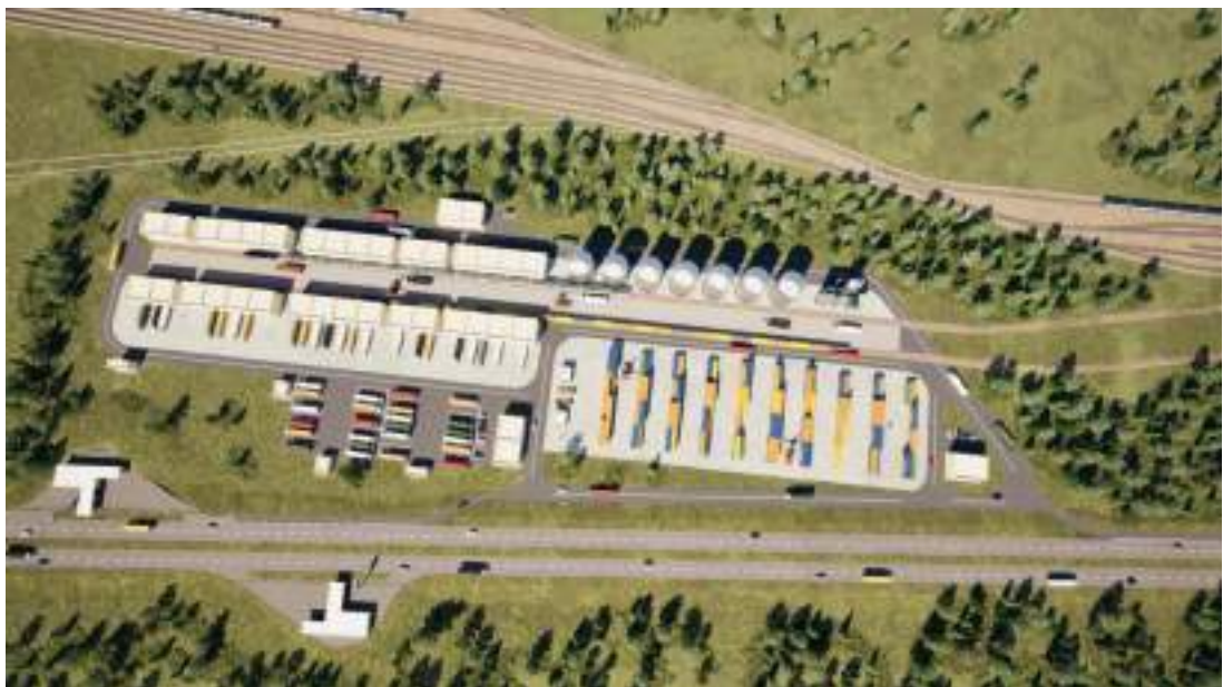
Рис. 1. Візуалізація проектної території

Територію проектування передбачено для влаштування транспортного підприємства у зв'язку з приляганням колії залізничного транспорту з південної та західної сторони. Проектом передбачається 2 залізничних колій, а також розміщення на ділянці складських приміщень, передбачено місце для зберігання як вантажного так і легкового транспорту. Спроектовано систему внутрішніх доріг та проїздів в межах розробки детального плану. Також передбачено влаштування додаткової під'їзної дороги та розміщення складів III ступеня вогнестійкості двох типів розмірів: 48*12 та 24*12 м.