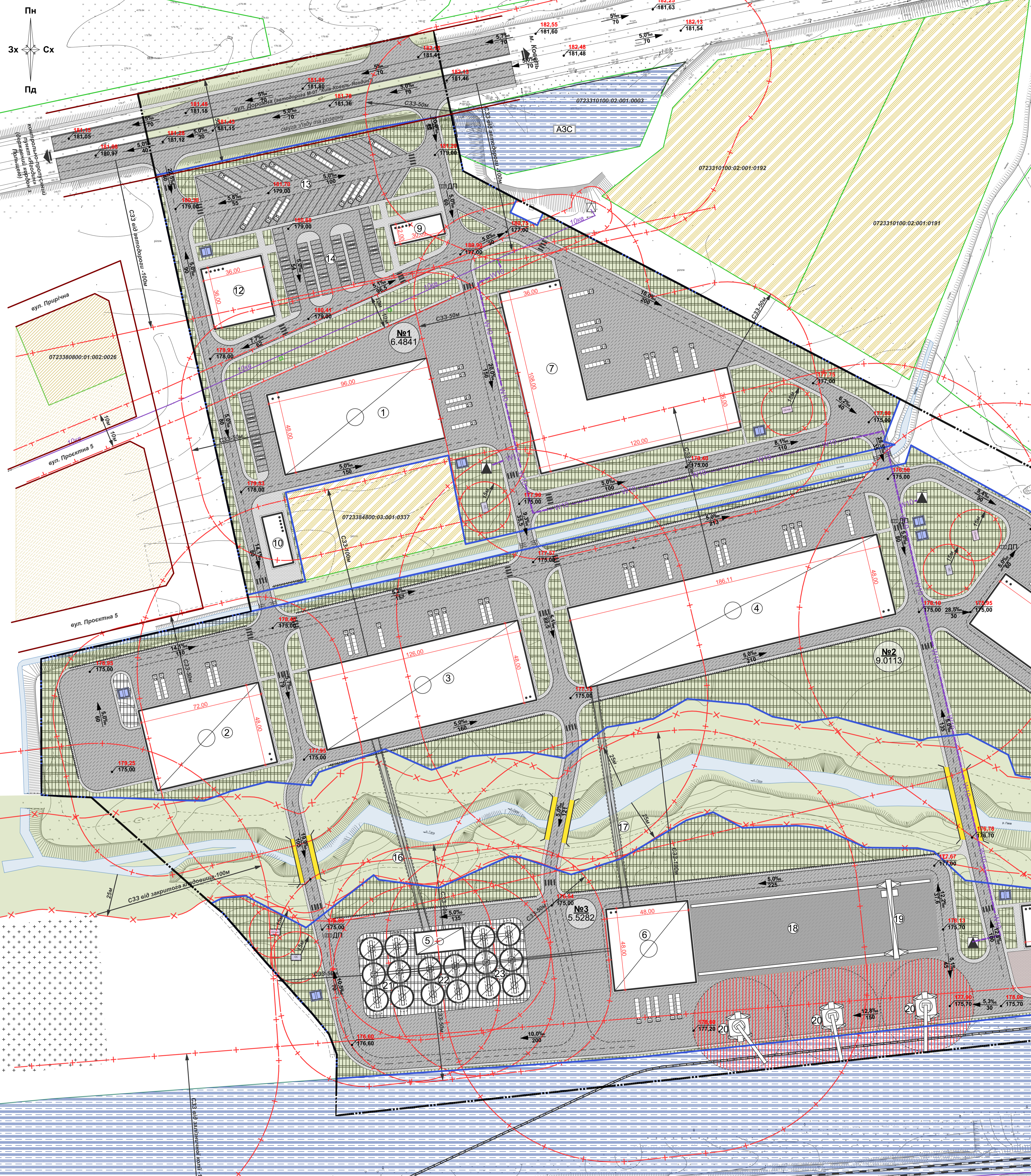
СХЕМА ІНЖЕНЕРНОЇ ПІДГОТОВКИ, БЛАГОУСТРОЮ ТЕРИТОРІЇ ТА ВЕРТИКАЛЬНОГО ПЛАНУВАННЯ М1:1000