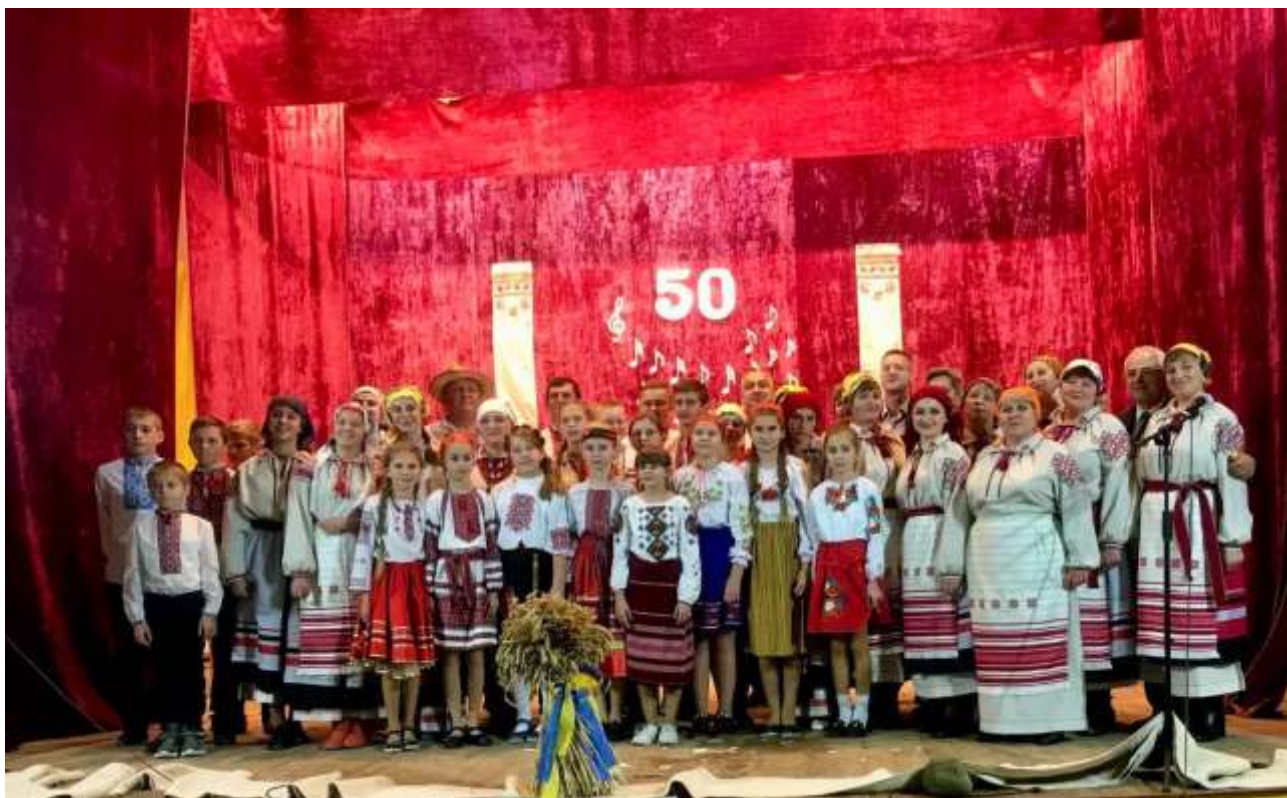
Аматорський фольклорний народний колектив «Перевесло»