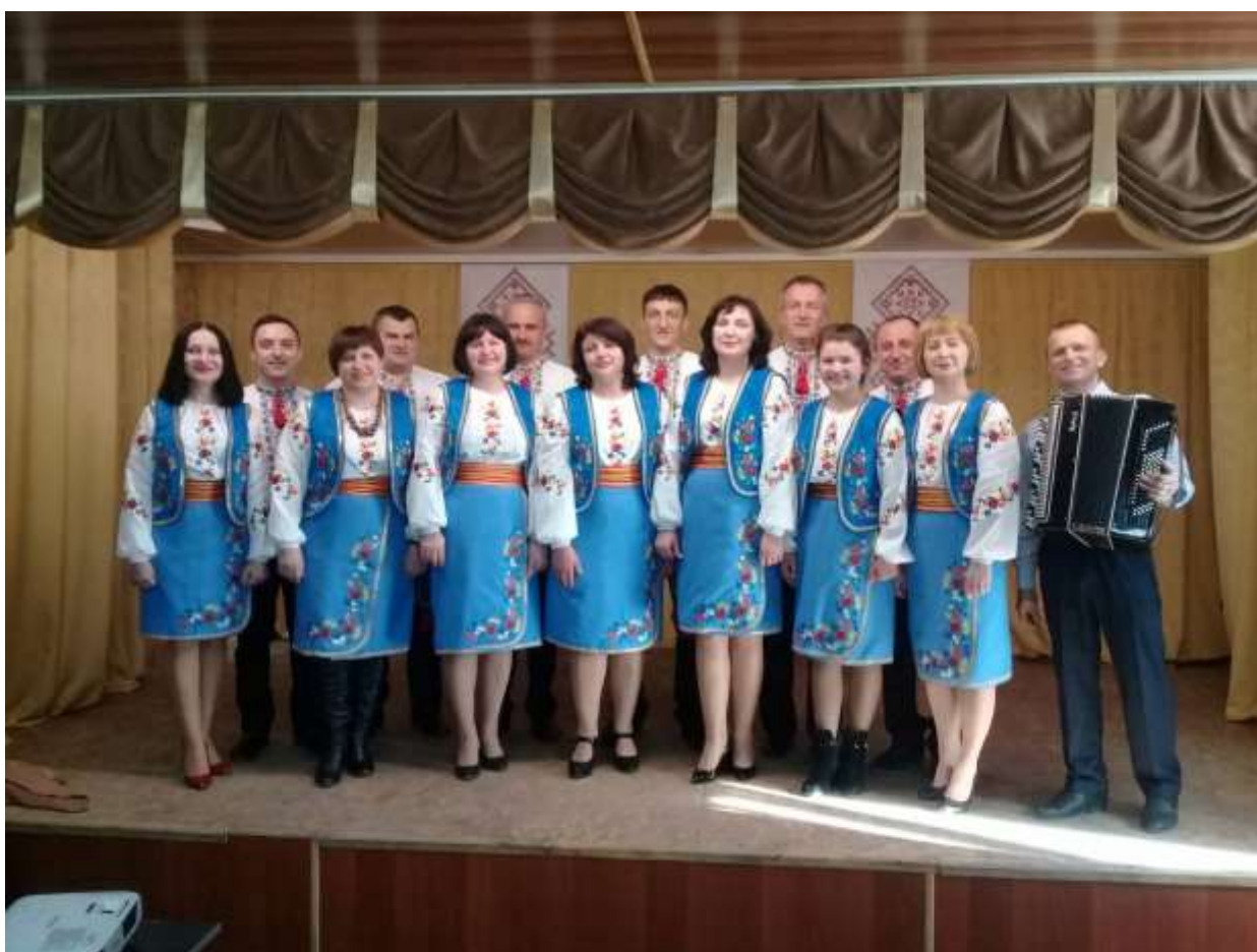
Аматорський колектив комунального закладу «Центр КМЕВС» «Вишневий цвіт»