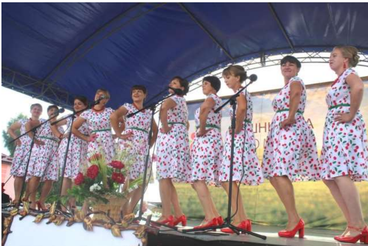
«Гламурні молодички» (Машівський сільський будинок культури)