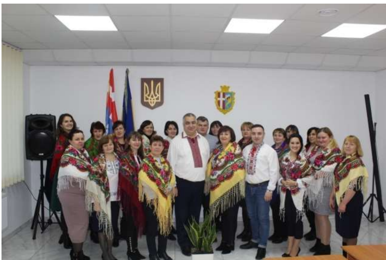
Виконавчий апарат Вишнівської сільської ради