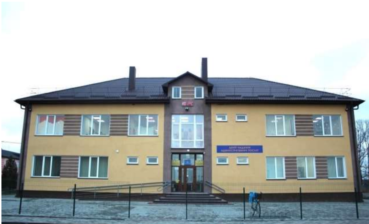
Адмінбудівля сільської ради