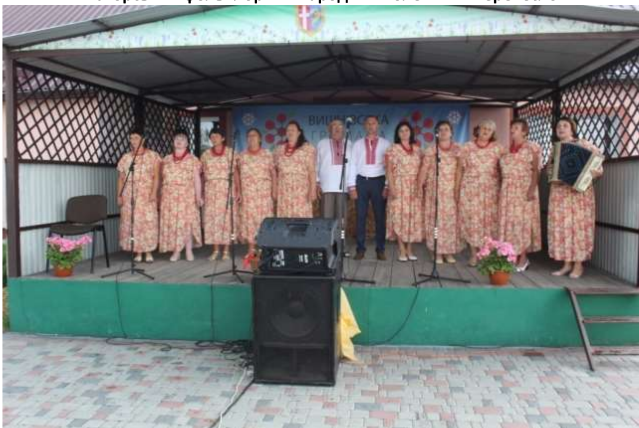
«Берегиня» (клуб с. Римачі)