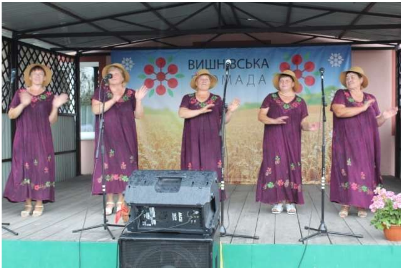
«Бережанка» (клуб с. Бережці)