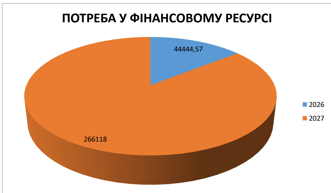
Рис. 3.1. Фінансовий ресурс на впровадження Плану заходів на 2026-2027 роки з реалізації Стратегії розвитку Новорайської сільської територіальної громади на 2026-2027 роки (з перспективою до 2034 року), тис.грн.

Планування потреби фінансового ресурсу на 2026-2027 роки для впровадження Плану заходів відносно різниця (рис. 3.1). У 2026 році на потреби з реалізації проектів місцевого розвитку планується залучити найменшу частку фінансового ресурсу, визначеного у Плані заходів, - 44444,57 тис.грн (15%). Найбільше планується використати у 2027 році – 266118 тис.грн. (85%).